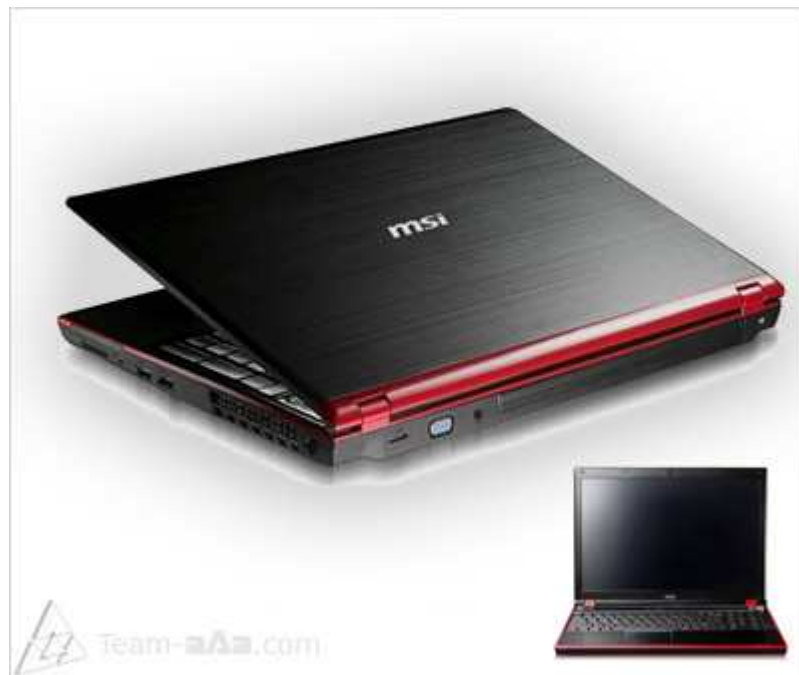
Le Notebook GX620-069