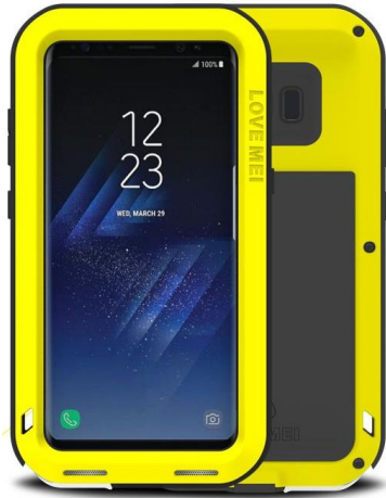
SAMSUNG Galaxy S8

Grâce à la robustesse de la coque LOVE MEI POWERFUL , votre smartphone peut être utilisé dans n'importe quelles conditions : dans le sable, sous la pluie... Sa résistance anti-choc permet de protéger son téléphone au travail mais également lors de ses sorties loisir. Les utilisateurs pourront ainsi continuer de profiter de leur téléphone dans toutes leurs activités. Plus aucune crainte : en bateau, à la plage, en voyage, en travaillant, en montagne, en moto, en vacances, en bricolant, en randonnée, à la piscine ou à la mer; n'ayez plus peur d'emmener votre téléphone !