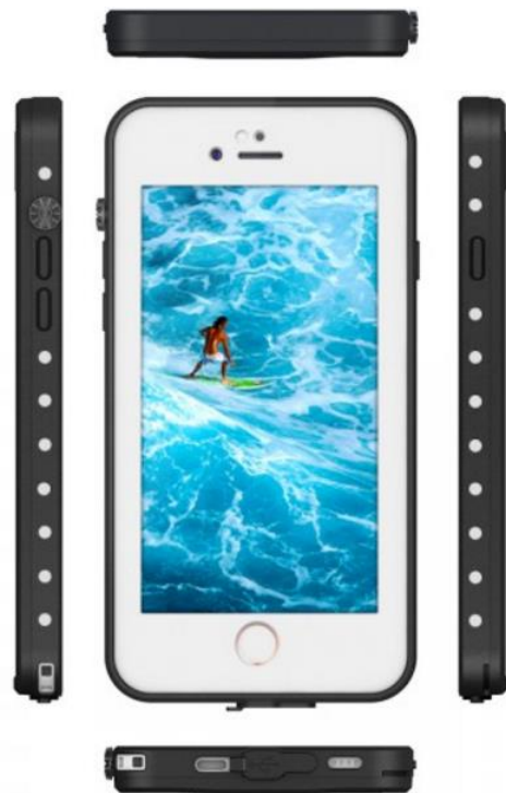
APPLE iPhone 7 +